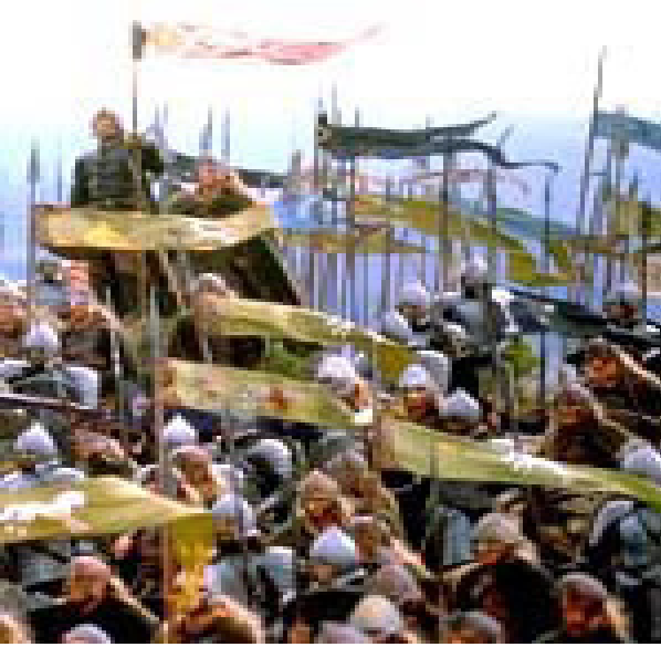
Yüzüklerin Efendisi : Yüzük Kardeşliği

Lord of the Rings: The Fellowship of the Ring